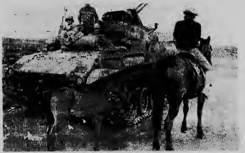
Soldanan di guardia Nacional norteamericano a usa tanque ayera den persecucion di e revolucionarionan di New Mexico cu a captura e ciudad Tierra Amarilla pa algun ora antayera. Riba cabai un sherifi a pasa pa check cu e solda tocante e ultimo acontecimientonan